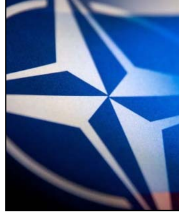
"NATO-nun Brüsseldəki mənzil-qərargahında daimi hərbi nümayəndələr və alyan-

Bildirilir ki, NATO-nun iyunun 11-12-də Vilyandə keçiriləcək sammitində "minlərlə səhifəlik gizli hərbi planların" təsdiq edilməsi təklif olunacaq. KİV-in məlumatına görə, Soyuq Müharibədən sonra ilk dəfə olaraq bu planlar Rusiya Federasiyası ilə birbaşa qarşıdurma ssenarisini ətraflı təsvir edəcək.