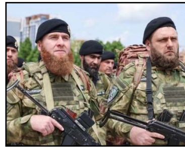
mağ üçün Kremldən göstəriş alıb.

Qeyd olunur ki, Çeçenistan Respublikasının rəhbəri Ramzan Kadırov, "Vaqner" döyüşçülərinin Baxmutdan çıxarılmasından sonra Ukraynada hücum əməliyyatlarına başla-