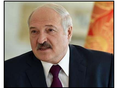
- deyə Lukaşenko yekunlaşdırıb.

"Başqa sözlə, ölkəmiz hakimiyyət dəyişikliyini üçün güclü ssenariyə hazırlanır, biz bunu görürük, imkan verməyəcəyik",